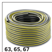
63, 65, 67