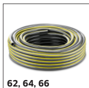
62, 64, 66