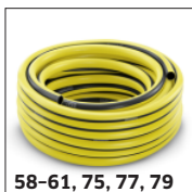
58-61, 75, 77, 79