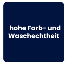
hohe Farb- und Waschechtheit