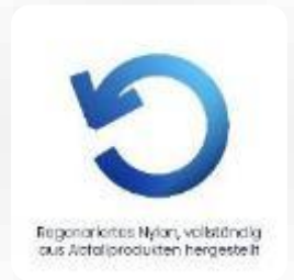
Regeneriertes Nylon, vollständig aus Abfallprodukten hergestellt