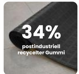
34% postindustriell recycelter Gummi