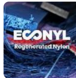
ECONYL Regenerated Nylon